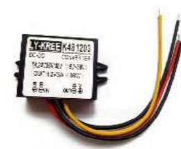
SSS-SD47 DCコンバータ (48V→12V)