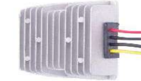
SSS-SD80 DCコンバータ (80V→12V)