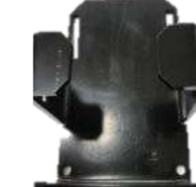
SSS-ST02 バッテリー用 ステー