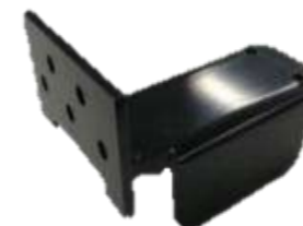
SSS-ST01 カメラステー ※SSS-CN03は不適合 ※SSS-CB01は不適合