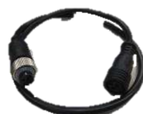
SSS-EK100 4ピン+4ピン 100cmカメラ 延長ケーブル