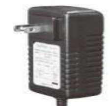
SSS-AC01 バッテリー充電用 ACアダプター