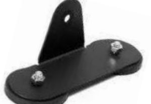
SSS-ST04 モニター専用 マグネットステー