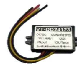
SSS-SD24 DCコンバータ (24V→12V)