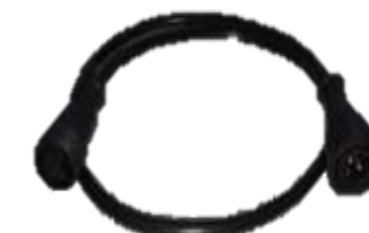
SSS-EK02 2ピン+2ピン 60cmカメラ 延長ケーブル