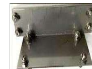
SSS-ST03 SSS-CN03専用 マグネットステー