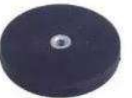
SSS-CBB2 CB01専用 マグネットベース ※SSS-CB01専用